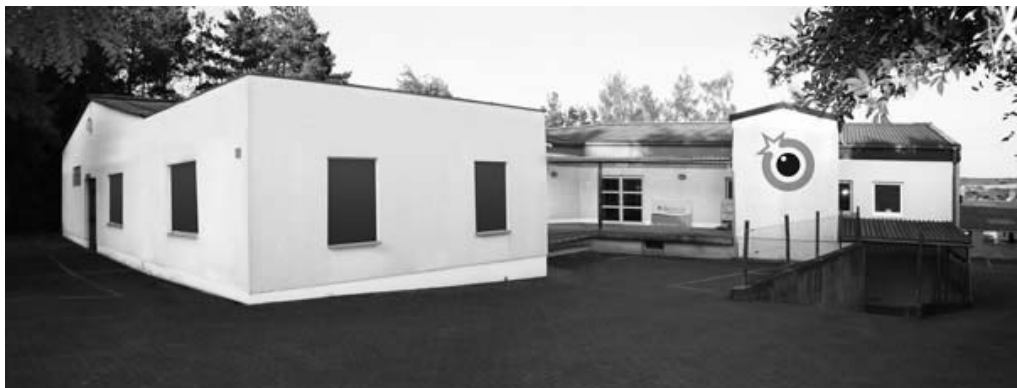
Abbildung 8 Produktionsstandort der EyeSee Druck & Design in Würzburg