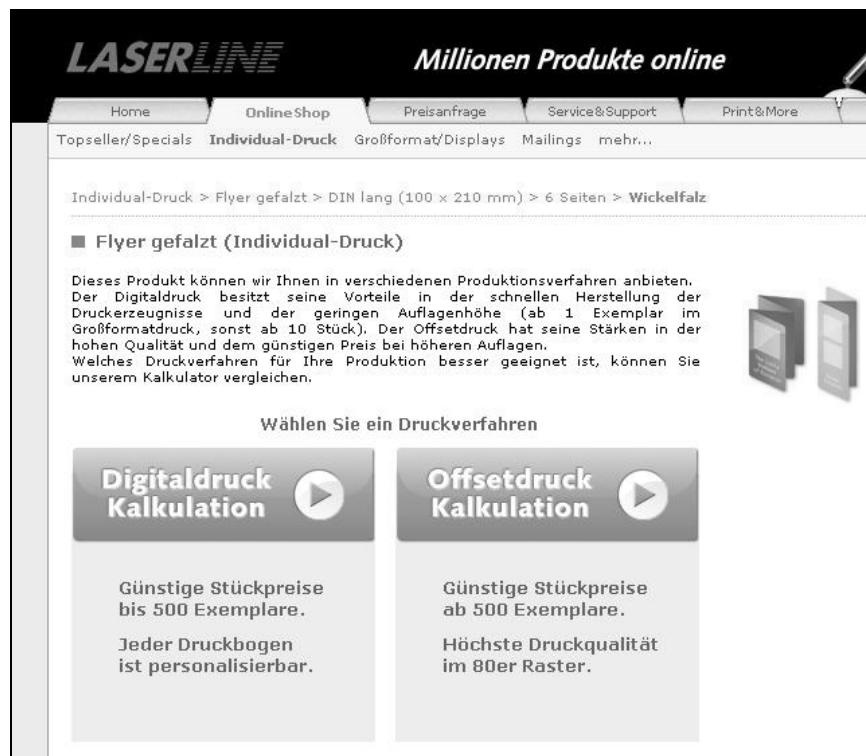
Abbildung 9 Alternative Kalkulationsmöglichkeit bei Laser-Line

Das Unternehmen gilt als Pionier der Online-Kalkulation (erster Shop 2003). 2007 erfolgte der Umzug in einen Neubau in zentraler Lage in Berlin. Laser-Line wurde 2007 von der IHK und der Handwerksammer als „Berlins bester Ausbildungsbetrieb“ ausgezeichnet und hat heute ca. 150 Mitarbeiter. Zertifiziert ist der Betrieb nach EN ISO 9001:2000 (Qualitätsmanagement), EN ISO 14001:2005 (Umweltmanagement) und OHSAS 18001 (Arbeitsschutzmanagement). Produziert wird sowohl im Digital- als auch im Bogenoffsetdruck. Die Entscheidung, welches Produktionsverfahren gewählt wird, wird dem Kunden überlassen. Dazu wird eine alternative Kalkulationsoberfläche angeboten (vgl. Abbildung).