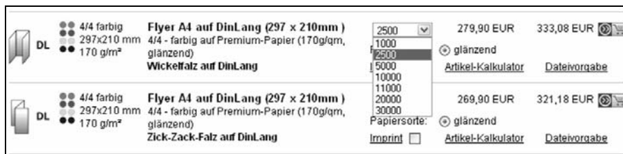
Abbildung 2 Beispiel für eine eingeschränkte Papier- und Auflagenwahl.

Wesentlich für die Erzielung von Kostenvorteilen einiger Internetdruckereien ist die Einschränkung der Auswahlmöglichkeiten des Kunden hinsichtlich der Auflage (keine individuelle Auflage bestellbar) und der Papierqualität (außer matt oder glänzend gestrichen kein Einfluss auf die Papiersorte; geringe bis keine Einflussmöglichkeiten auf die Grammaturn – dadurch in Einzelfällen eventuell keine Portooptimierung möglich). Dadurch sind Vorteile im Materialeinkauf und in den Rüstzeiten möglich. Außerdem kann insbesondere bei den Faltblättern in kleinem Format und in kleiner Auflage der Druck in Sammelformen durchgeführt werden.