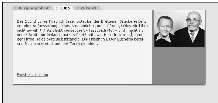
Abbildung 12 Eine „Internetdruckerei“ mit Tradition [esserdruck.de, 07. 09. 2008]

ist es ein Full-Service-Betrieb mit Schwerpunkt im hochwertigen Digitaldruck, u. a. auf einer HP Indigo Press 3050. 2008 erfolgte der Spatenstich in einen Erweiterungsbau.