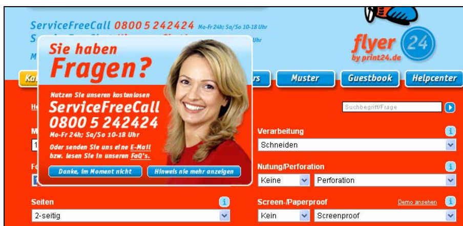
Abbildung 6 Kostenlose Telefonberatung.

Außer für den Aufbau und die Pflege des Internetportals fallen keine Kosten im Vertrieb an. Telefonische Beratung wird allerdings von einigen Anbietern kostenlos angeboten und nimmt nach persönlicher Aussage eines interviewten Anbieters stark zu.