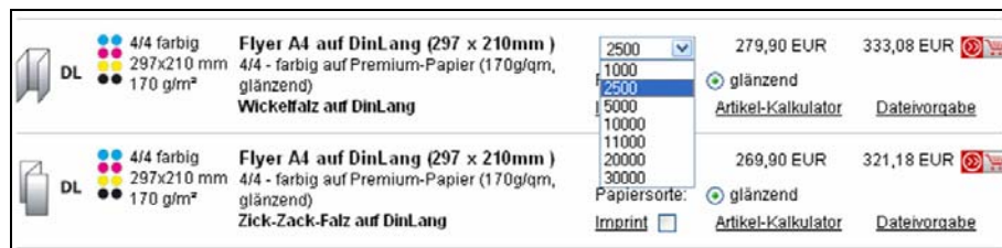
Abbildung 3 Beispiel für eine eingeschränkte Papier- und Auflagenwahl. Quelle: www.bullflyer.de [04. 11. 2007]

Wesentlich für die Erzielung von Kostenvorteilen einiger Internetdruckereien ist die Einschränkung der Auswahlmöglichkeiten des Kunden hinsichtlich der Auflage (keine individuelle Auflage bestellbar) und der Papierqualität (außer matt oder glänzend gestrichen kein Einfluss auf die Papiersorte; geringe bis keine Einflussmöglichkeiten auf die Grammaturn – dadurch in Einzelfällen eventuell keine Portooptimierung möglich). Dadurch sind Vorteile im Materialeinkauf und in den Rüstzeiten möglich. Außerdem kann insbesondere bei den Faltblättern in kleinem Format und in kleiner Auflage der Druck in Sammelformen durchgeführt werden.